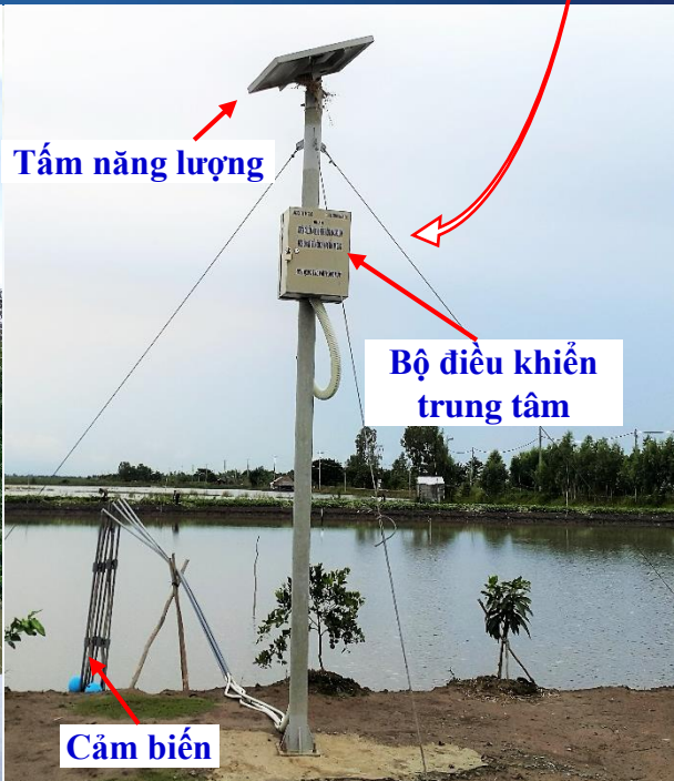
Giám sát môi trường nước ao nuôi