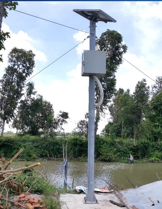
Giám sát xâm nhập mặn