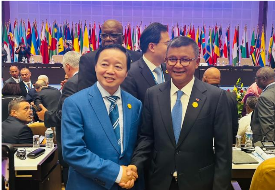
Phó Thủ tướng Trần Hồng Hà gặp gỡ Phó Thủ tướng Campuchia Hang Chuon Naron