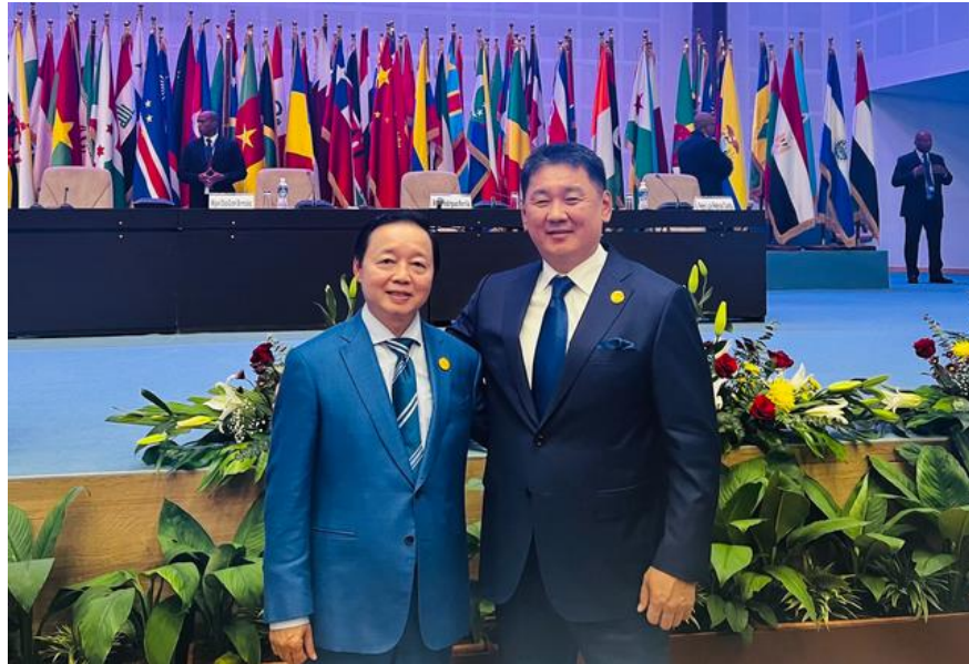
Phó Thủ tướng Trần Hồng Hà và Tổng thống Mông Cổ Ukhnaa Khurelsukh