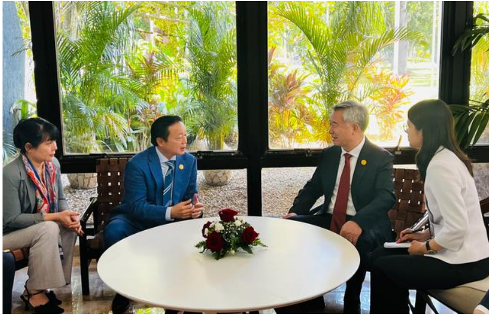
Phó Thủ tướng Trần Hồng Hà gặp Ủy viên Thường vụ Bộ Chính trị, Bí thư Ủy ban Kiểm tra kỷ luật Trung ương Đảng Cộng sản Trung Quốc Lý Hi