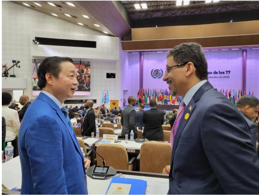
Phó Thủ tướng Trần Hồng Hà trao đổi với Ngoại trưởng Yemen Ahmed Awad bin Mubarak