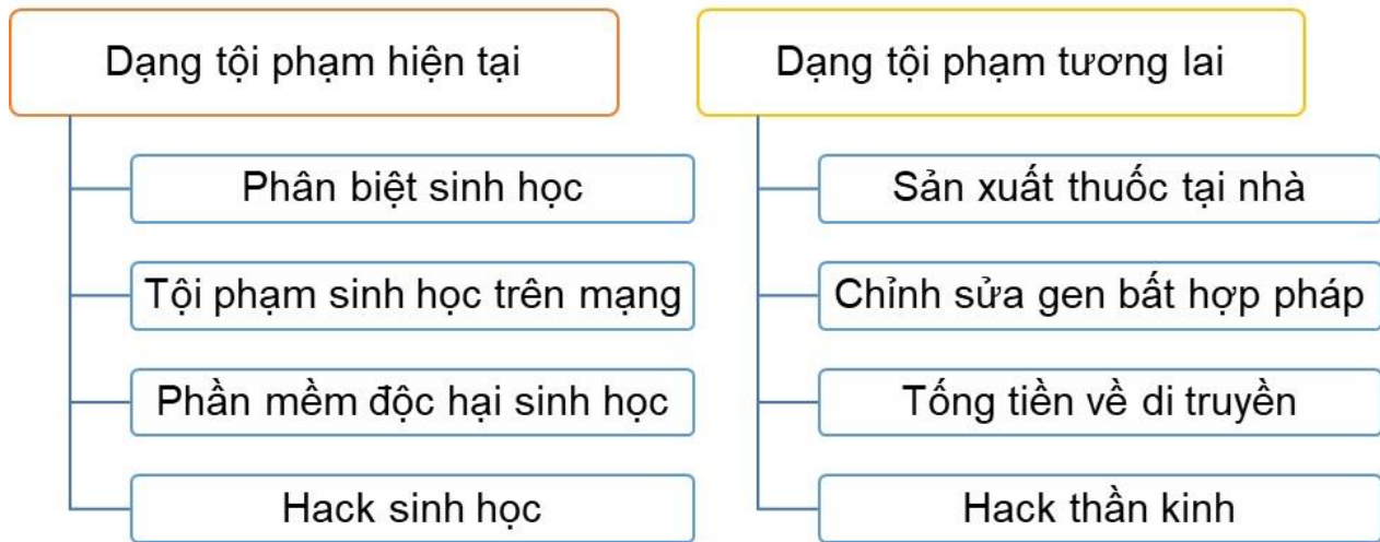
Hình 2. Các dạng tội phạm sinh học đã xuất hiện và trong tương lai.

Sau khi nghiên cứu các trường hợp tội phạm sinh học, Elgabry và cs. [3] cũng đã tổng hợp theo chủ đề và thống kê được 13 vụ tội phạm sinh học đã xảy ra. Nhóm nghiên cứu cũng phân loại tám loại tội phạm tiềm ẩn xuất hiện từ các nghiên cứu gồm: phân biệt sinh học (Bio-discrimination); tội phạm sinh học trên mạng (Cyber-biocrime); phần mềm độc hại sinh học (Bio-malware); hack sinh học (Biohacking); sản xuất thuốc tại nhà (at home drug manufacturing); chỉnh sửa gen bất hợp pháp (Illegal gene editing); tống tiền về di truyền (Genetic blackmail); hack thần kinh (Neuro-hacking). Các tội phạm này có thể được phân thành hai nhóm chính là tội phạm hiện có và tội phạm tương lai, dựa trên khả năng xảy ra các hành vi này (hình 2).