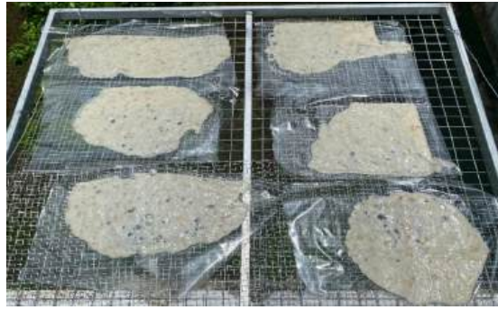
Định hình và phơi khô