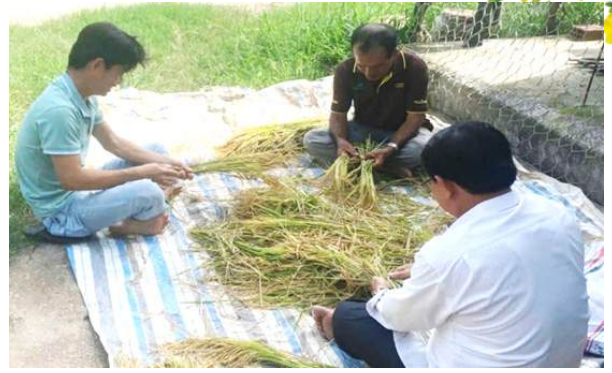
Lấy chỉ tiêu năng suất lý thuyết thí nghiệm đánh giá hiệu quả của sản phẩm

cải tạo đất phù hợp QCVN 01-189:2019/BNNPTNT. Bên cạnh đó, giá thể còn có hàm lượng chất hữu cơ, đạm tổng số, lân hữu hiệu, kali hữu hiệu, độ ẩm đạt chỉ tiêu chất lượng của phân hữu cơ và phân hữu cơ vi sinh; có tỷ lệ C/N đạt chỉ tiêu chất lượng của phân hữu cơ vi sinh và gần đạt chỉ tiêu chất lượng của phân bón hữu cơ (yếu tố này có thể được cải thiện nếu tăng liều lượng chế phẩm sinh học và/hoặc thời gian ủ nguyên liệu). Như vậy, quy trình sản xuất phân bón hữu cơ cải tạo đất có bổ sung phế phụ phẩm từ chế biến gạo được nghiên cứu đạt chỉ tiêu chất lượng chính phù hợp QCVN 01-189:2019/BNNPTNT), đáp ứng mục tiêu của Kế hoạch. Qua đó, nhóm nghiên cứu đã chọn quy trình sản xuất ở nghiệm thức 3 (bổ sung cặn lắng nước rửa gạo 15% khối lượng nguyên liệu) để tiến hành thực hiện Nội dung 2 - Bố trí thí nghiệm đánh giá hiệu quả của sản phẩm trong vụ lúa Thu Đông năm 2025 tại Trung tâm CNSH.