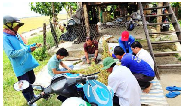
Lấy chỉ tiêu phân tích năng suất