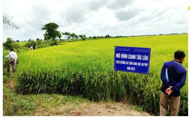
Tổ chức Hội thảo và đánh giá trên đồng ruộng

Thêm vào đó, hiệu quả kinh tế của mô hình đem lại còn giúp nông dân giảm chi phí sản xuất và cũng như nguy cơ sức khỏe khi sử dụng và tiếp xúc với thuốc bảo vệ thực vật.