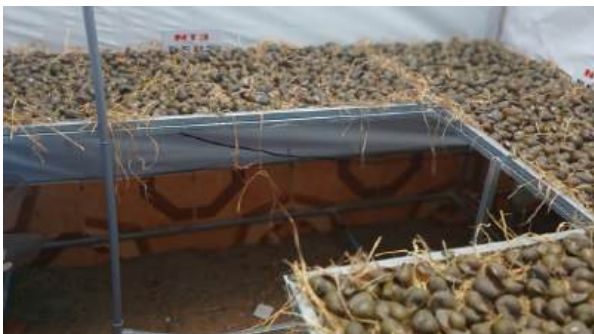
Rom khô được làm đệm lót cho ốc ở giai đoạn chuyển hoá

- Duy trì nhiệt độ phòng 32 o C bằng thiết bị phun mưa được lắp đặt trên mái che, máy sưởi hoặc đèn để nâng nhiệt độ trong phòng thông qua bộ cảm biến nhiệt độ, quạt thông gió. Mái che được làm bằng tấm poly lấy sáng với tỷ lệ lấy sáng đạt mức 24% tạo điều kiện ánh sáng cho ốc chuyển hóa dinh dưỡng và tạo màu sắc cho ốc thành phẩm.