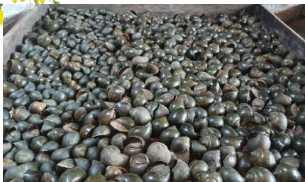
Ốc được quạt cho khô nước trước khi đưa vào thuận nhiệt độ

mới góp phần nâng cao giá trị trên cùng một sản phẩm, giải quyết vấn đề đầu ra cho người nuôi ốc thương phẩm trước tình hình nguồn cung tăng cao, liên kết với người nuôi bao tiêu đầu ra sản phẩm để phát triển nghề nuôi ốc theo hướng bền vững.