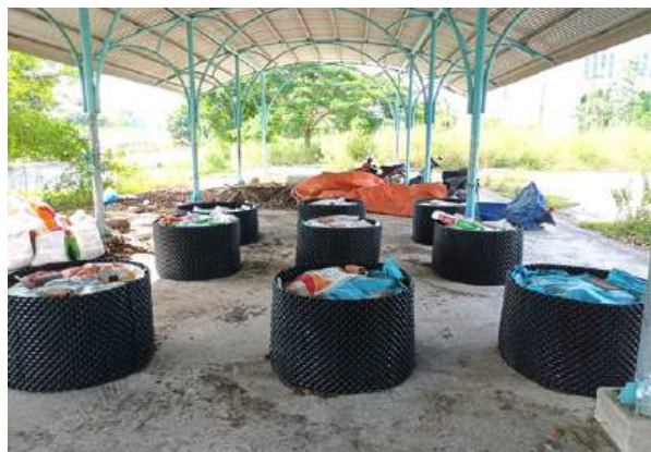
Bố trí thí nghiệm ủ giá thể

(ii) Quy trình canh tác lúa sử dụng sản phẩm phân bón hữu cơ cải tạo đất để thay thế ít nhất 15% lượng phân bón vô cơ theo khuyến cáo.