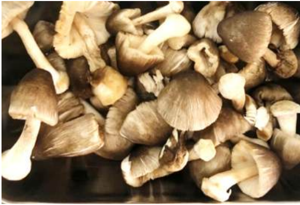
Nguyên liệu nấm rơm đã nở rộng mũ để hư hỏng khi bán tươi