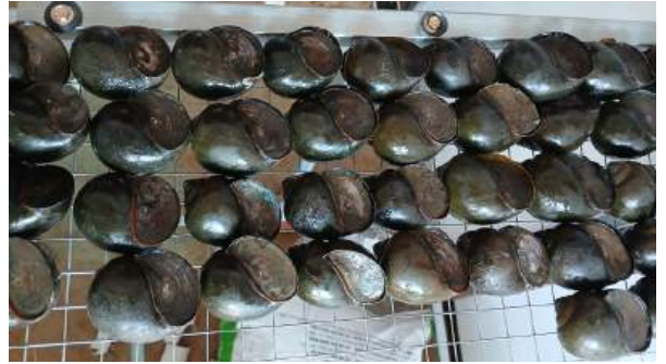
Ốc nguyên liệu

Ốc sống trong môi trường nước bắt mồi theo hình thức bị động là chủ yếu, dùng vòi hút các loại thức ăn rồi đưa vào miệng tiêu hóa dần để nuôi dưỡng cơ thể và lớn dần. Trong điều kiện sống ngoài tự nhiên ốc có một cơ chế rất đặc biệt là trong điều khô hạn, không có nguồn thức ăn, ốc sẽ nằm yên một chỗ rồi tận dụng nguồn dinh dưỡng tích lũy trong cơ thể để duy trì sự sống, đây được xem là hình thức tiềm sinh của ốc bươu, trong quá trình tiềm sinh ốc tận dụng lượng dinh dưỡng không có ích ở phần đỉnh ốc để chuyển hóa thành các khối cơ