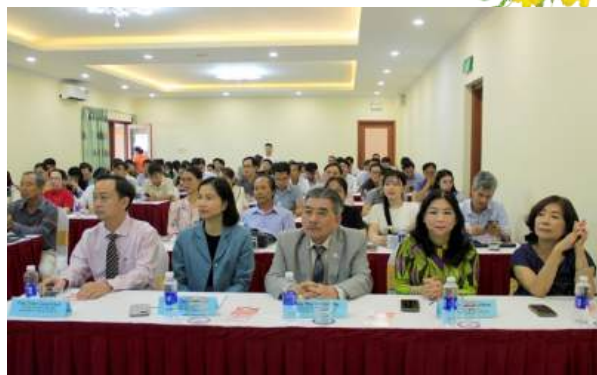
Đại biểu tham dự Hội nghị

là chiến lược then chốt giúp doanh nghiệp Việt Nam tạo dựng vị thế vững chắc, nâng cao lợi thế cạnh tranh trên cả thị trường trong nước và quốc tế.