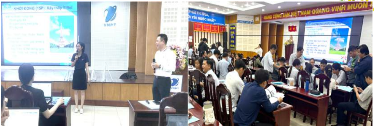
Các đại biểu thực hành và thuyết trình tại Hội nghị

tiếp các ứng dụng AI trong công việc như: chuyển văn bản thành giọng nói, tạo hình ảnh, video từ nội dung số hóa; xây dựng nhân vật ảo cho truyền thông số và tạo video ngắn bằng công cụ AI.