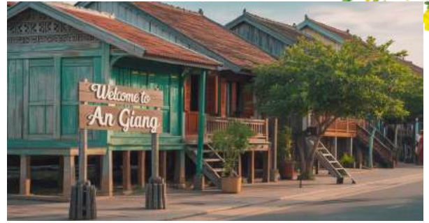
Kiểu nhà đặc trưng của dân tộc kinh

phần phục vụ phát triển du lịch An Giang. Thông qua việc đánh giá thực trạng bảo tồn các giá trị văn hóa truyền thống bốn dân tộc: Kinh, Hoa, Chăm, Khmer và tiềm năng du lịch văn hóa của bốn dân tộc này trên địa bàn tỉnh An Giang, từ đó đề xuất xây dựng Đề án xây dựng Làng văn hóa bốn dân tộc: Kinh, Hoa, Chăm, Khmer phục vụ du lịch An Giang, cùng Mô hình 3D về xây dựng Làng văn hóa bốn dân tộc: Kinh, Hoa, Chăm, Khmer nhằm kêu gọi nhà đầu tư.