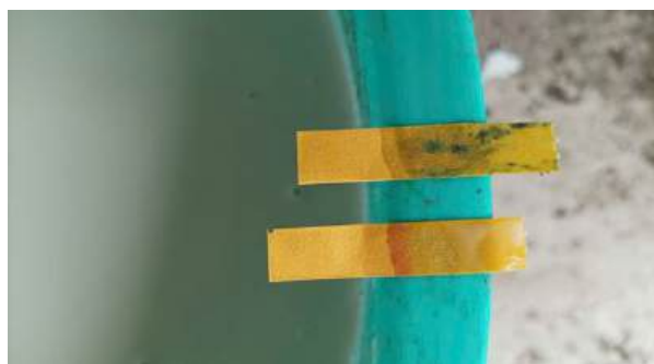
Xử lý điều chỉnh pH của cặn lắng nước rửa gạo

Kết quả cho thấy, giá thể bổ sung cặn lắng nước rửa gạo ở cả 03 nghiệm thức đều đạt chỉ tiêu chất lượng chính của phân hữu cơ