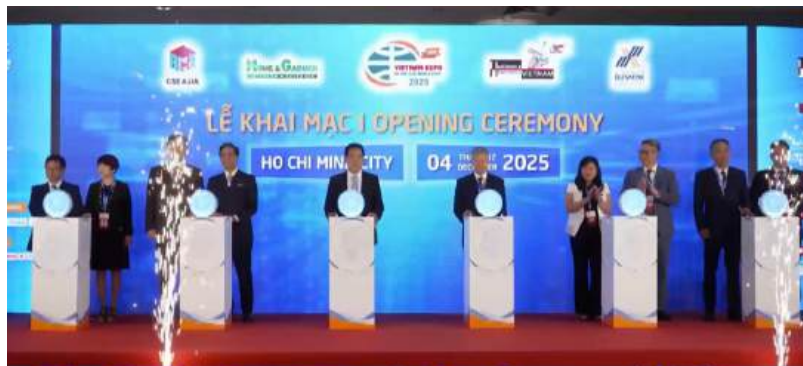
Quang cảnh lễ Khai mạc Hội chợ

Sự kiện quy tụ hơn 1.000 gian hàng của 800 doanh nghiệp và tổ chức xúc tiến đến từ hơn 20 quốc gia và vùng lãnh thổ, tập trung vào 4 lĩnh vực chủ yếu: Thực phẩm và tiêu dùng thông minh; thiết bị điện – điện tử gia dụng; trang trí nhà, vườn và cảnh quan; thiết bị và dụng cụ DIY (Do It Yourself - Tự tay làm lấy). Sự kết hợp này mở ra một không gian giao thương toàn diện, từ công nghiệp hỗ trợ, thiết bị – công nghệ, sản phẩm ứng