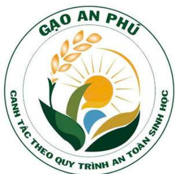
Nhãn hiệu (logo) Gạo An Phú đã nộp hồ sơ đăng ký bảo hộ

- Quy trình, gieo sạ thưa (11-12 kg/công), bón 4 lần phân ở giai đoạn sinh trưởng và sinh sản, không bón khi lúa đã trổ hạt.