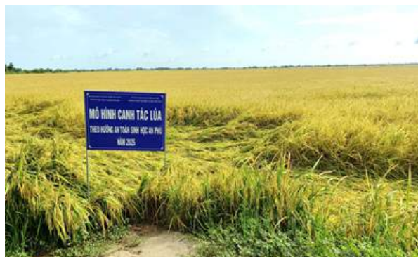
Mô hình sản xuất lúa theo hướng an toàn sinh học

(4) Xây dựng tiêu chuẩn cơ sở đối với sản phẩm gạo gắn với quy trình canh tác lúa theo hướng ATSH