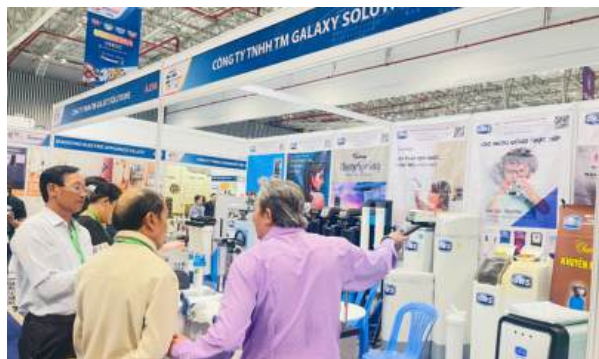
Thành viên đoàn trao đổi thông tin với đơn vị cung cấp công nghệ lọc nước

Sau quá trình tham quan, trao đổi, kết nối... đoàn công tác đã hoàn thành đúng kế hoạch, đảm bảo hiệu quả, an toàn. Việc tham dự Hội chợ không chỉ giúp các đơn vị của Đoàn cập nhật xu hướng công nghệ hiện đại mà còn mở ra cơ hội hợp tác, chuyển giao kỹ thuật và tìm kiếm nguồn cung ứng phù hợp, góp phần nâng cao năng lực cạnh tranh của các doanh nghiệp và thúc đẩy phát triển thị trường KH&CN địa phương./.