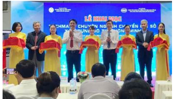
Lễ khai mạc Techmart

Bên cạnh đó, đoàn cũng tham dự Hội chợ triển lãm “Hàng công nghiệp nông thôn – khơi nguồn đổi mới, thúc đẩy thương hiệu Việt Nam 2025”, qua đó khảo sát các sản phẩm công nghiệp nông thôn, làng nghề truyền thống, máy móc, thiết bị và giải pháp công nghệ mới, phục vụ định hướng đổi mới công nghệ, nâng cao giá trị sản phẩm địa phương.