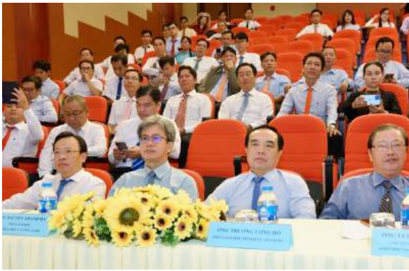
Quang cảnh Lễ Tổng kết – Trao giải