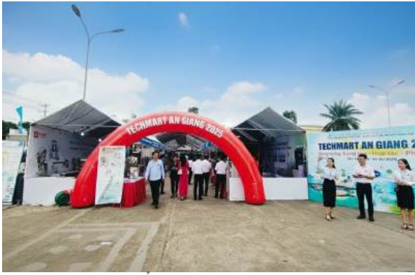
Triển lãm Techmart 2025

đánh giá mức độ an toàn hệ thống thông tin và thành lập Tiểu ban An toàn, An ninh mạng.