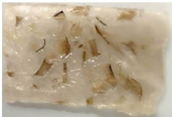
Mẫu bánh bông nếp trước khi chiên