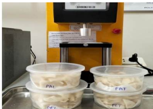
Bánh bông sau khi chiên và phân tích cấu trúc bánh

Về công đoạn làm khô và bảo quản, nghiên cứu đã xác định phương pháp sấy đôi lưu ở nhiệt độ 65^{\circ}\text{C} trong thời gian 4 giờ là chế độ sấy hiệu quả nhất. Nhiệt độ này đủ để tách ẩm ra khỏi sản phẩm đưa về độ ẩm an toàn khoảng 4,22% mà không gây ra phản ứng Maillard làm sậm màu bánh như khi sấy ở nhiệt độ cao 75^{\circ}\text{C} . Để đảm bảo hạn sử dụng lâu dài, quy trình đóng gói sử dụng bao bì PA hút chân không và bảo quản ở nhiệt độ mát từ 20 đến 25^{\circ}\text{C} đã được khuyến nghị. Kết quả theo dõi cho thấy mẫu sản phẩm được bảo quản theo quy trình này duy trì chất lượng ổn định nhất, hoạt động nước được kiểm soát ở mức thấp giúp ngăn chặn hoàn toàn sự phát triển của nấm mốc và vi sinh vật, đồng thời giữ nguyên được độ giòn và màu sắc ban đầu của bánh trong thời gian dài và ở nhiệt độ thường.