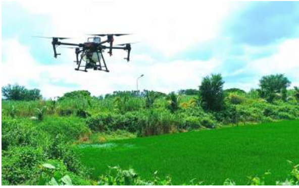
Bố trí thí nghiệm đánh giá hiệu quả của sản phẩm