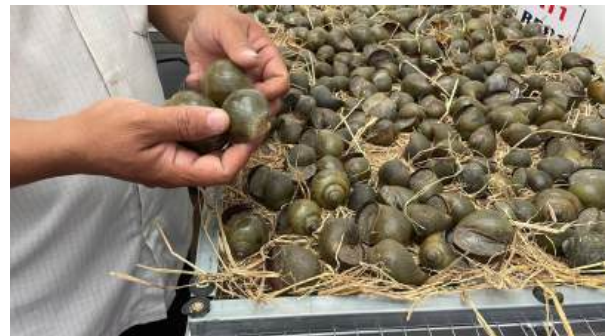
Kiểm tra phân loại ốc

- Hằng ngày theo dõi ốc, loại bỏ ốc chết.