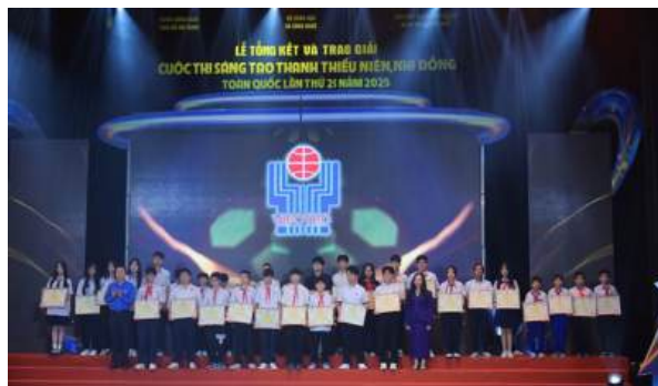
Các tác giả, nhóm tác giả được trao Giải Khuyến khích tại lễ trao giải Cuộc thi

gian, tạo nên một tác phẩm vừa sinh động vừa mang đậm không khí Tết cổ truyền.