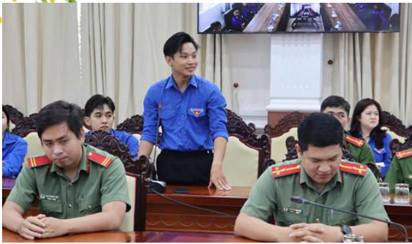
Đoàn viên, thanh niên đặt câu hỏi