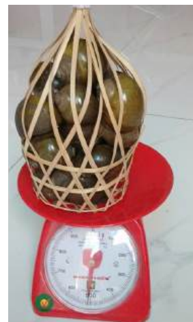
Ốc Thành phẩm

- Sau 04 tháng theo dõi, ốc đã chuyển hóa dinh dưỡng theo hướng tích cực và sản phẩm thành phẩm là ốc tiềm sinh có chất lượng màu sắc rất bắt mắt, mùi thơm đặc trưng của thịt ốc, vị ngọt, chất lượng giòn ngon./