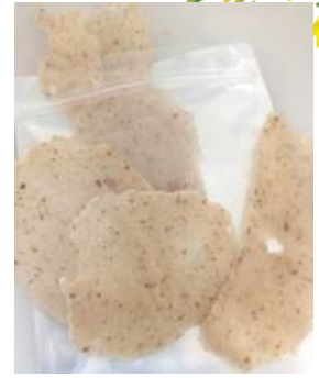
Bánh phồng nếp nấm thành phẩm

còn tạo ra dòng thực phẩm giàu chất xơ, đáp ứng nhu cầu thực phẩm chức năng và tốt cho sức khỏe của nhóm người tiêu dùng hiện đại, đặc biệt là những người ăn chay hoặc quan tâm đến sức khỏe.