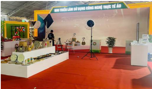
Khu trải nghiệm công nghệ thực tế ảo tại Techmart

Tại Techmart chuyên ngành “Chuyển đổi số xây dựng đô thị thông minh”, đoàn công tác đã tham quan, tìm hiểu các gian hàng trưng bày, giới thiệu công nghệ, thiết bị và giải pháp số trong nhiều lĩnh vực như: quản lý, điều hành đô thị thông minh; y tế thông minh; giáo dục số; du lịch thông minh. Đồng thời, đoàn tham dự các hội thảo, chuyên đề trình diễn công nghệ và hoạt động tư vấn trực tiếp của các chuyên gia đến từ các cơ quan, tổ chức và doanh nghiệp công nghệ.