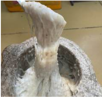
Công đoạn quét nếp và nấm rom làm bánh phồng nếp