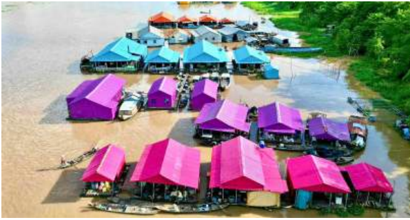
Làng bè sắc màu