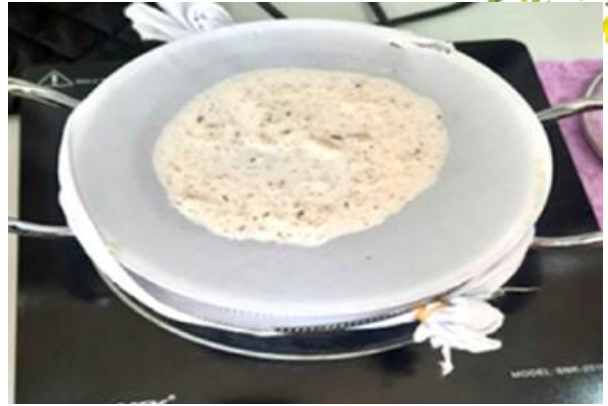
Quy trình hấp bánh