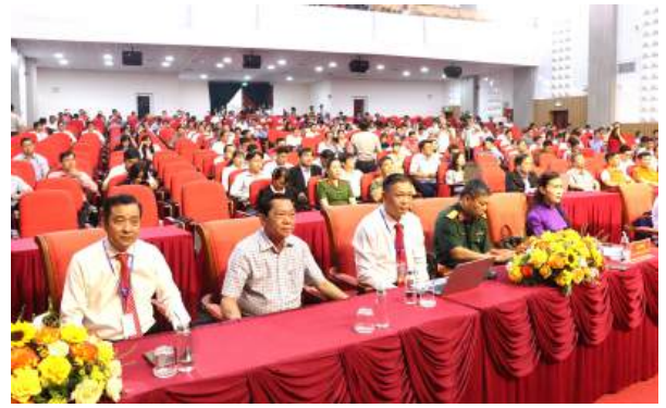
Đại biểu tham dự hội thảo Chuyển đổi số năm 2025

Liên kết vùng và hợp tác là một trụ cột quan trọng của kế hoạch. Theo đó, tỉnh An Giang tăng cường hợp tác với